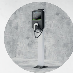
OSZTLOPRA SZERELT TÖLTŐ