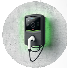
HÁTTÉRVILÁGÍTÁSSAL RENDELKEZŐ TÖLTŐ