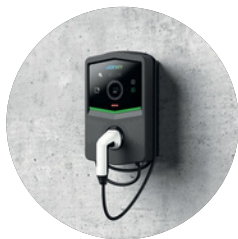
FALRA SZERELT TÖLTŐ